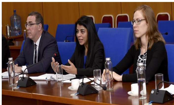
Phái đoàn Quỹ Tiền tệ quốc tế (IMF)

Bên cạnh đó, triển vọng tích cực của nền kinh tế Việt Nam sau khi mở cửa trở lại, quy mô dân số lớn và số người gia nhập tầng lớp trung lưu ngày càng tăng cũng là những yếu tố thuận lợi để thu hút đầu tư. Rõ ràng, với mục tiêu đón FDI chất lượng cao, mang lại giá trị cao hơn, yếu tố chất lượng luôn được đặt lên hàng đầu.